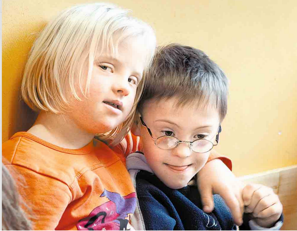
Schülerinnen und Schüler an der SOPHIE-SCHOLL-SCHULE IN GIESSEN